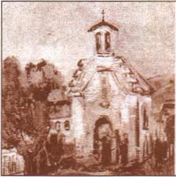
A kápolna homlokzatán márványtábla hirdeti latin nyelven:

az Oroszlány-ófalusi Szent József Kápolna