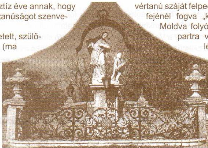
Nepomuki Szent János

Mint mondják, maga Vencel kínoztatta égő fáklyákkal Jánost, az érsek általános helynökét, majd a