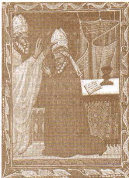
István király Gellértet püspökké nevezte ki

J gen nagy volt tisztelete korában és a későbbi korokban is. Személyében az első magyarföldi nevelőt, első főiskola-alapítót, az első magyarlelkű vértanú püspököt tisztelték, és tiszteljük ma is.